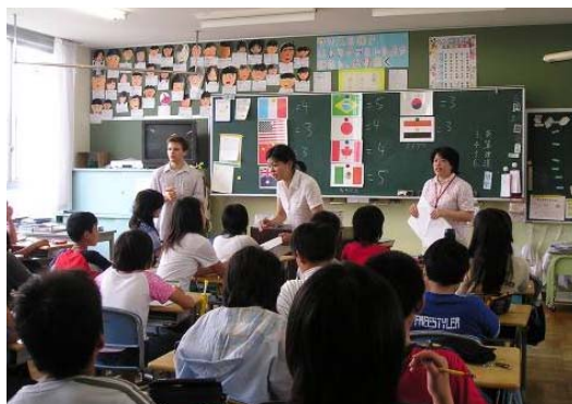
楽しい小学校英語！