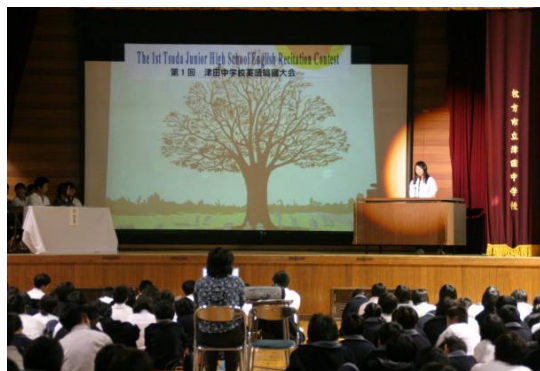
中学校では英語暗唱大会！