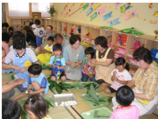
地域のみなさんと一緒に笹まきづくり