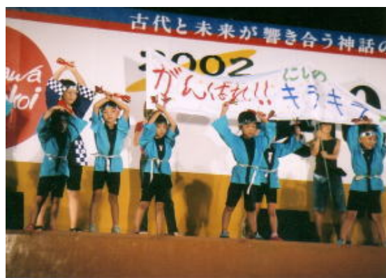
斐川町よさこい祭りに参加