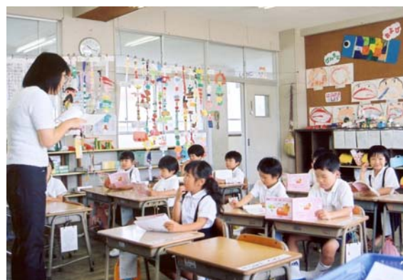
輝く子どもたちの授業風景