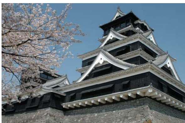
築城400年を迎える熊本城