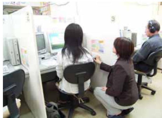
講師による個別指導