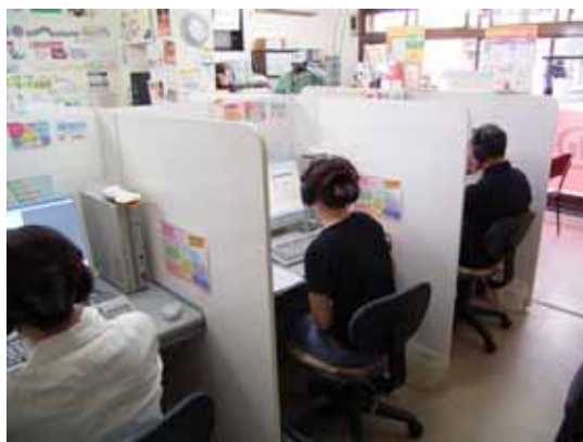
パソコン教室による個別学習