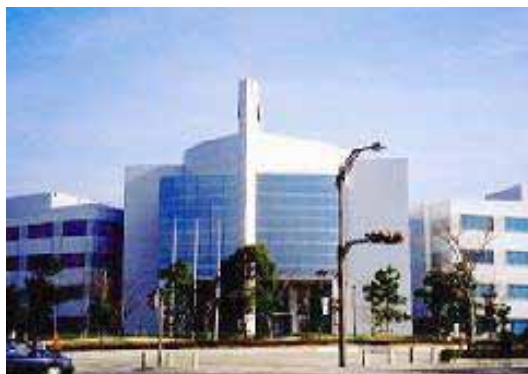
ひたちなかテクノセンター