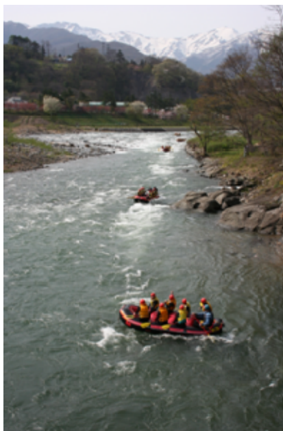
利根川清流でのラフティング