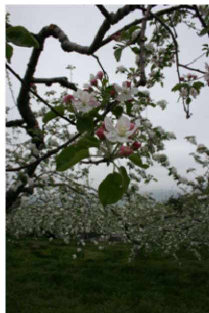
観光農園に咲くりんごの花