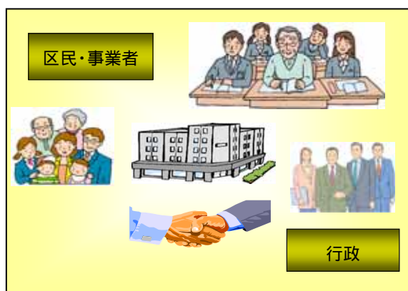
地域情報化の推進