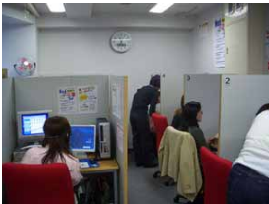
IT 資格関連講座 自習の様子