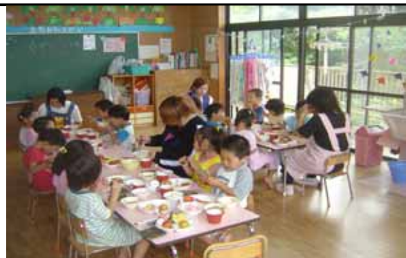
高校生との交流会