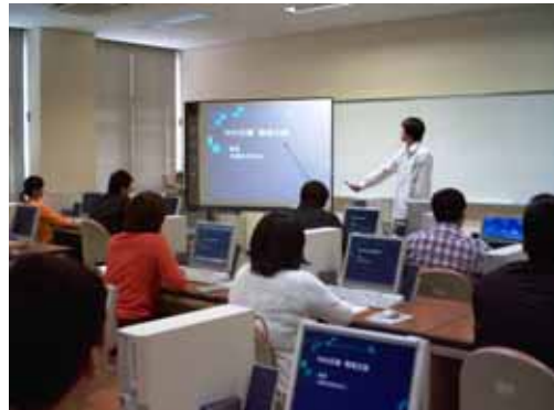
（若年者等雇用創出・就業支援の取組例）