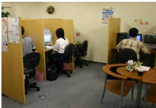
（パソコン・スクールでの学習例）

適用される規制の特例措置： ・ 修了者に対する初級システムアドミニストレータ試験の午前試験を免除する講座開設事業 ・ 修了者に対する基本情報技術者試験の午前試験を免除する講座開設事業