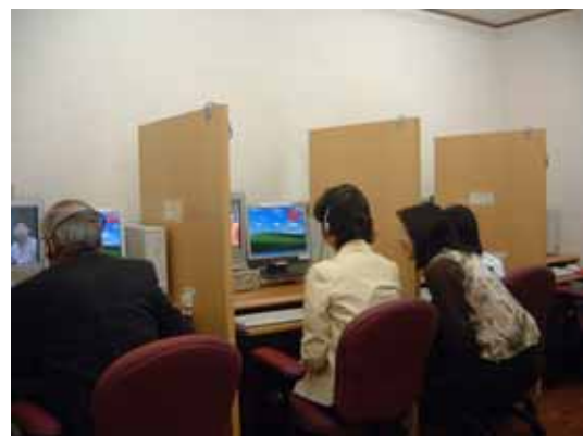
IT資格に関連する講座の様子