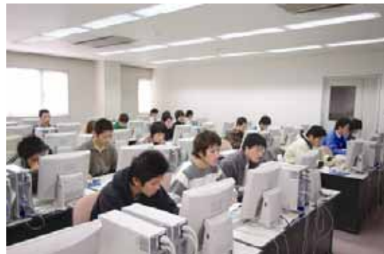
I C T 資格に関連する講座の授業風景