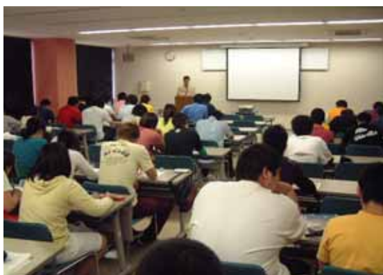
「周南市市民交流センター」IT講座