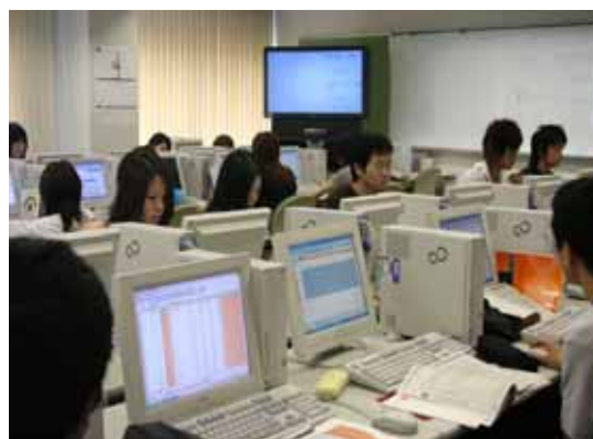
「山口キャリアデザイン専門学校」IT講座