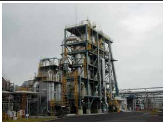
特別管理産業廃棄物中間処理施設