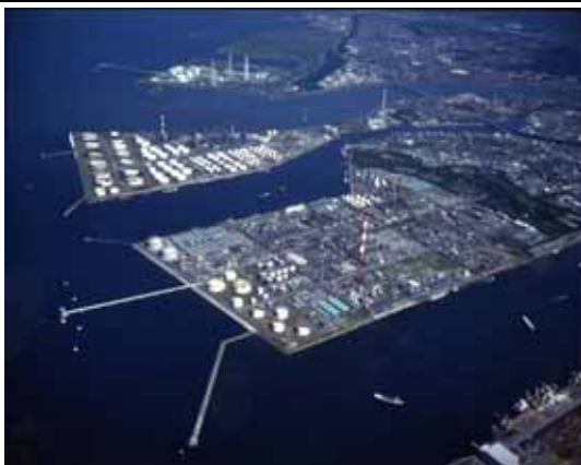
大分臨海コンビナート

適用される規制の特例措置： ・ 特別管理産業廃棄物の運搬に係るパイプライン使用の特例事業