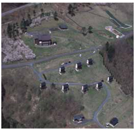
軽米町ミレットパーク 雑穀をテーマとした公園