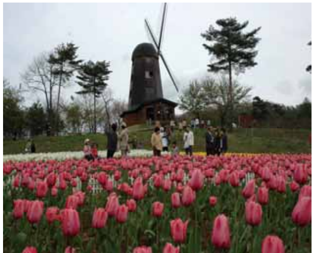
雪谷川ダムフォリストパーク・軽米 水と緑とチューリップが調和した公園