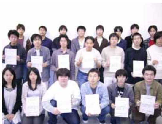
情報処理技術者試験の合格者