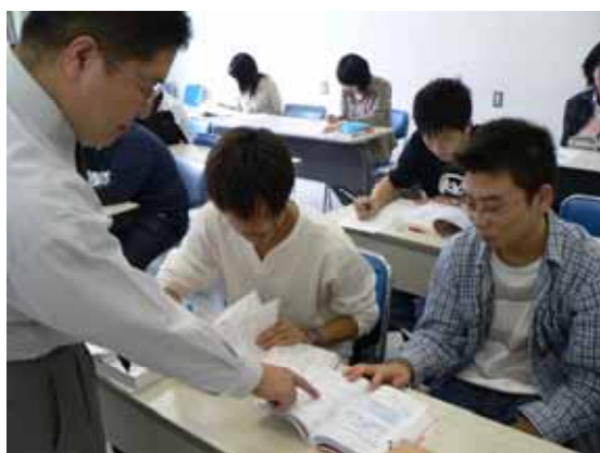
IT資格に関連する講座の様子