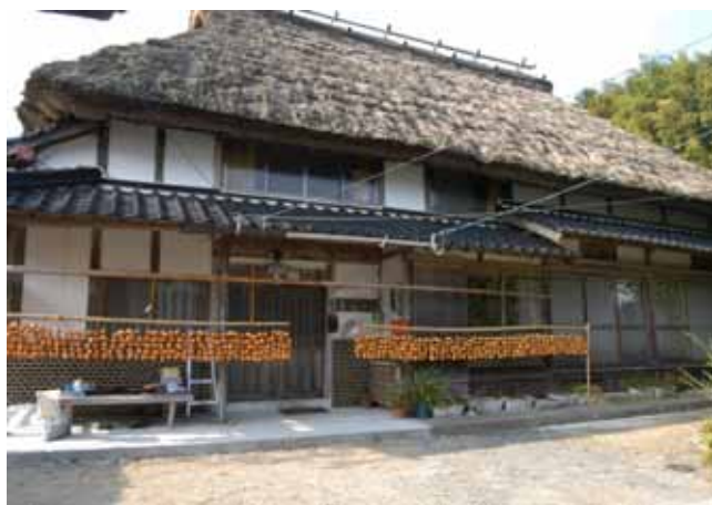
秋の風物詩、加茂地域での吊るし柿