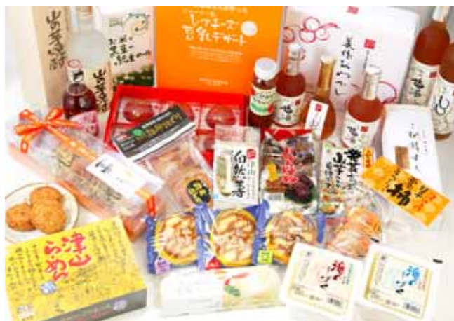
産学官民の連携により開発された地域農畜産物加工品「つやま夢みのり」ブランド商品