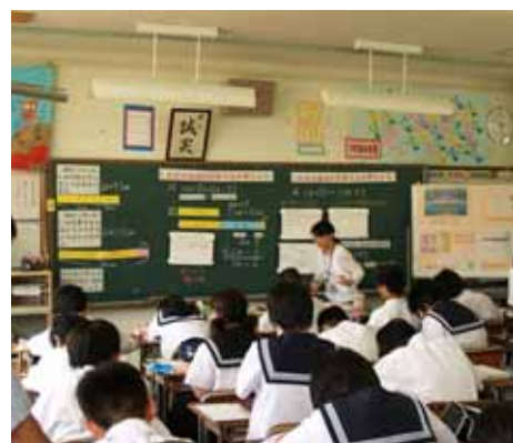
小学校教師による中学校での授業風景