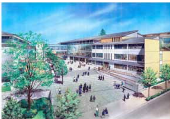
新設統合第一小・中学校（仮称）イメージ