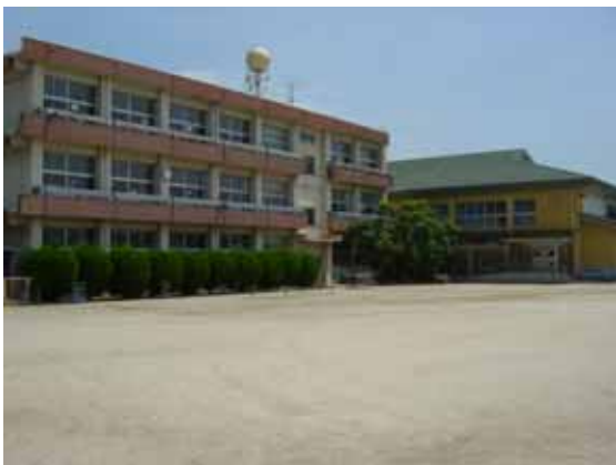
（大分市立賀来小学校）