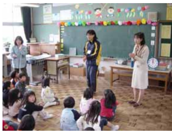
（賀来小学校における英語活動）