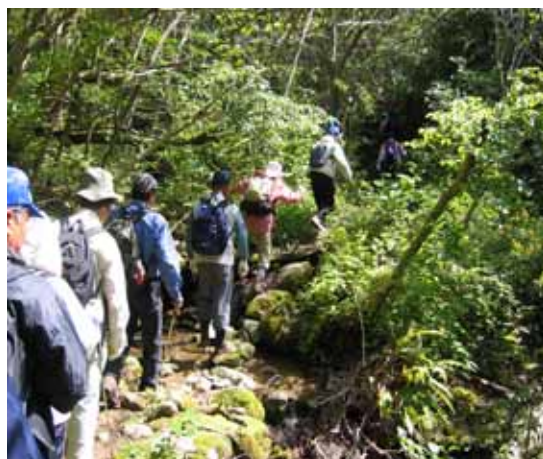
国見山系登山風景