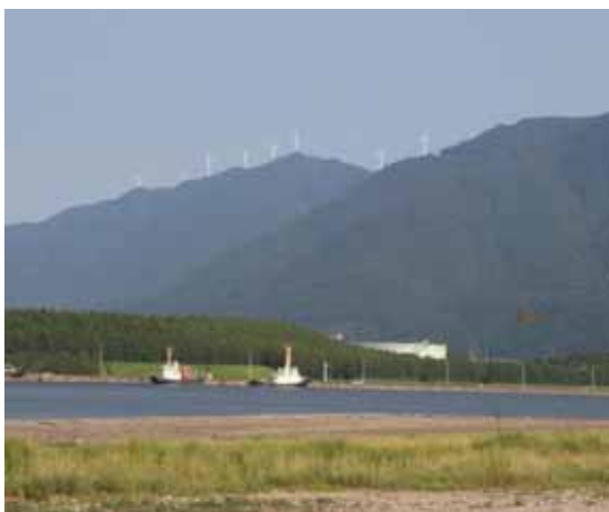
国見山風力発電事業イメージ写真