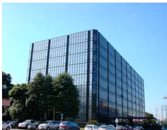
【アジア起業家村の拠点 THINK】