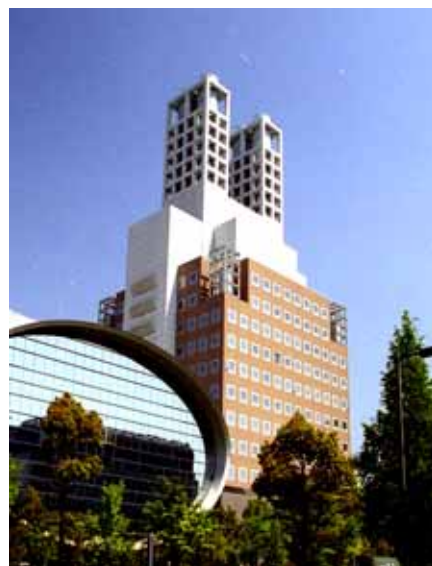
情報関連企業の集積拠点 「ソフトピアジャパン」