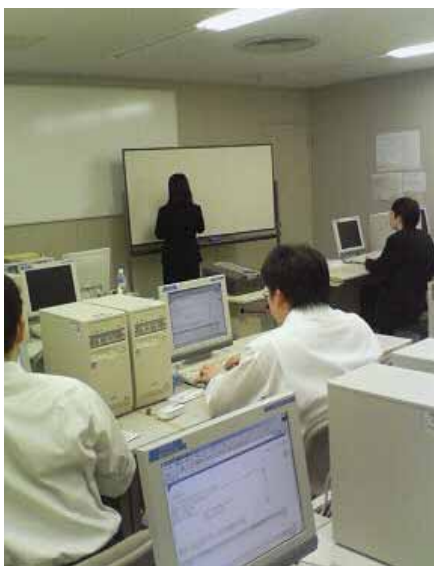
IT資格に関連する講座の様子

適用される規制の特例措置： ・講座修了者に対する初級システムアドミニストレータ試験の一部免除 ・講座修了者に対する基本情報技術者試験の一部免除