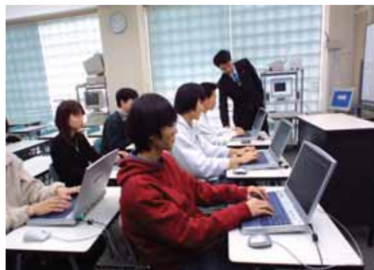
情報処理技術者試験に係る講座の授業風景