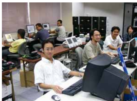
外国人留学生が起業したIT系 ベンチャー企業の業務風景