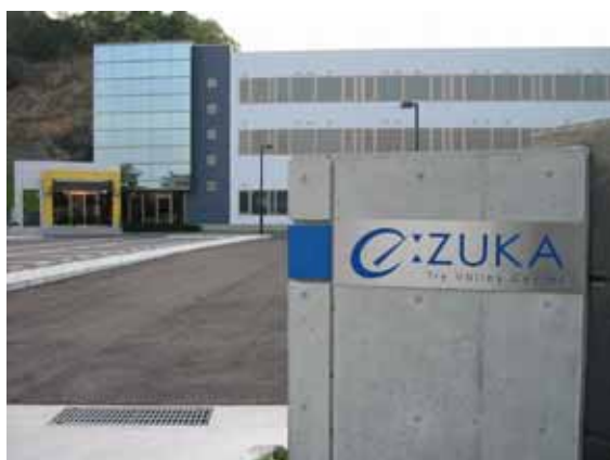
中核インキュベーション施設 【e-ZUKA トライバレーセンター】

適用される規制の特例措置： ・外国人研究者の受入れ促進 ・外国人の入国、在留申請の優先処理 ・外国人情報処理技術者の在留期間延長 ・地方公共団体の助成等による外国企業支店等の開設促進