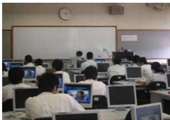
特例措置を受けた学校の授業風景