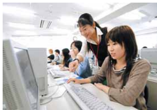
I T 資格に関連する講座の様子