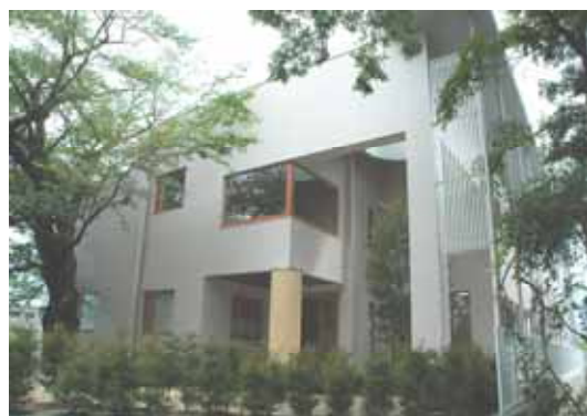
新事業研究・創出の拠点となる インキュベーションセンター