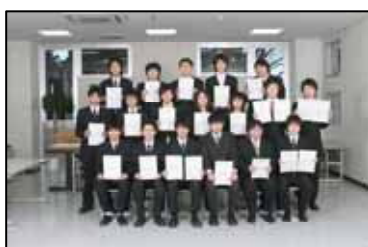
情報処理技術者試験の合格者