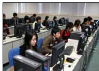
I T 資格関連講座の様子

適用される規制の特例措置： ・講座修了者に対する初級システムアドミニストレータ試験の一部免除 ・講座修了者に対する基本情報技術者試験の一部免除