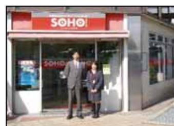
SOHO つちうらの起業家