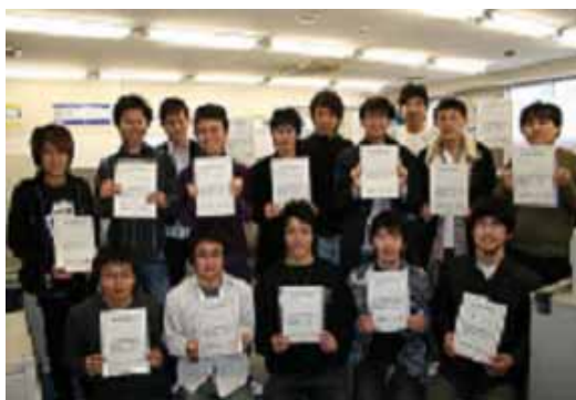
基本情報処理技術者試験の合格者