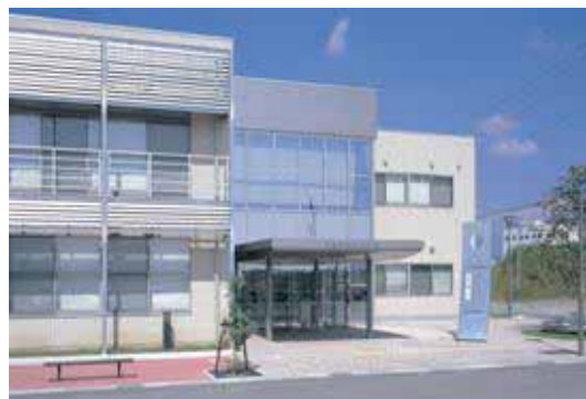
高崎市産業創造館