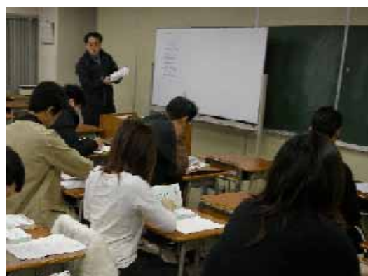
I T 関連の授業を受ける学生・社会人