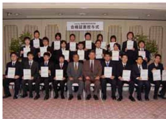
情報処理技術者試験の合格者