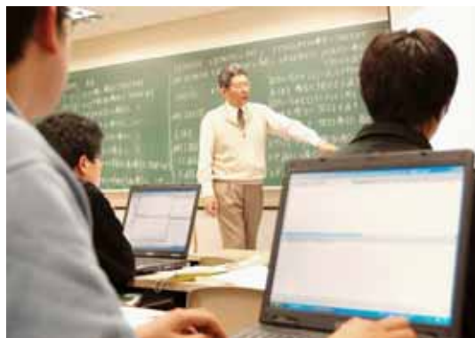
IT試験に関連する講座の様子