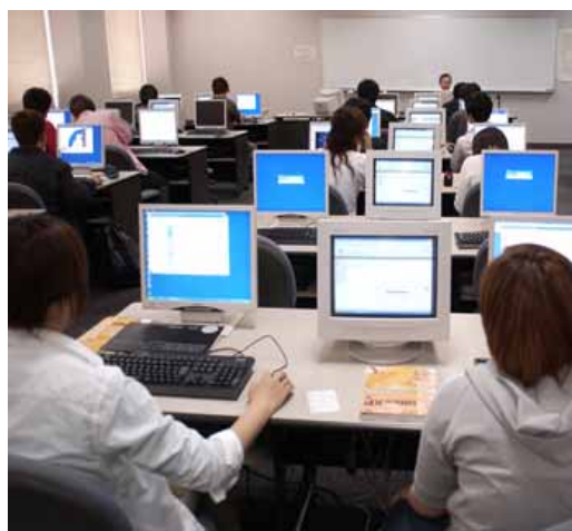
I T 資格に関連する講座の様子