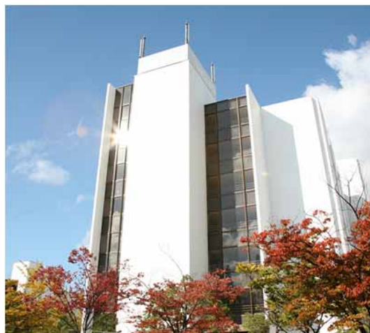
講座を設置する事業体の外観