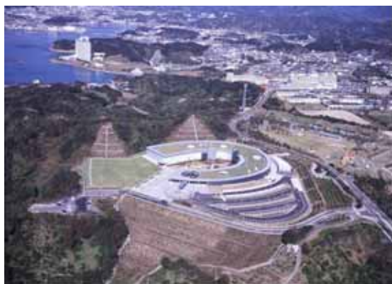
和歌山県立情報交流センター（Big・U）