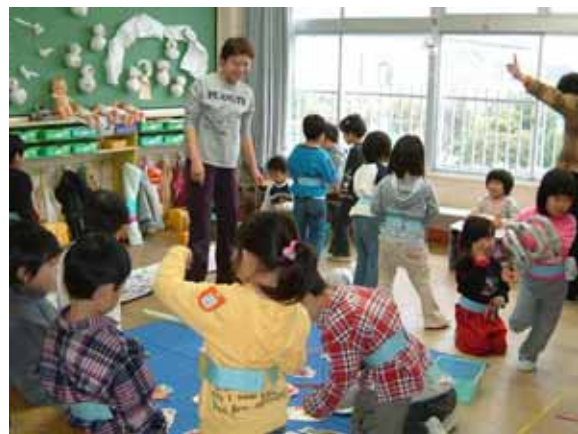
保育室での集団あそびの様子