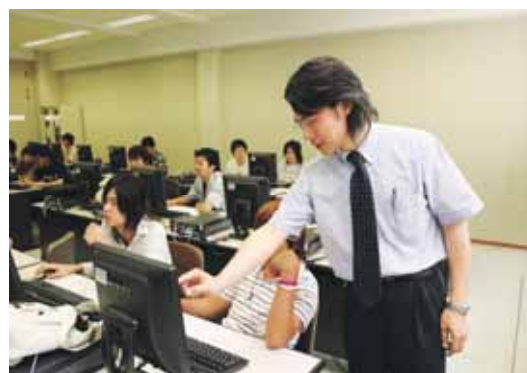
I T 資格に関する講座の様子