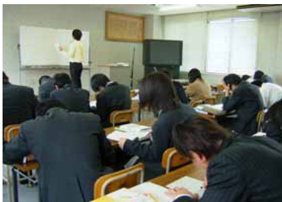
I T 資格に関連する講座の受講風景