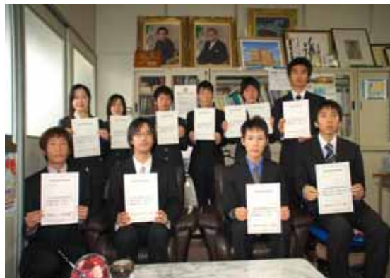
情報処理技術者試験の合格者