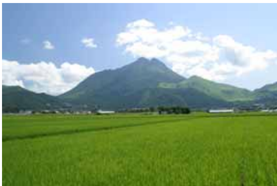
由布岳と田園風景