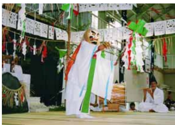
地域の歴史や文化、自然、産業等について小・中・高等学校12年間を通して学ぶ「地域学」