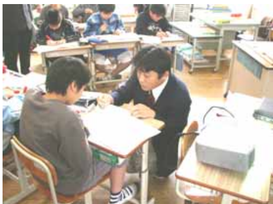
小中学校兼務教員による小学校での学習指導 「第6学年算数科」