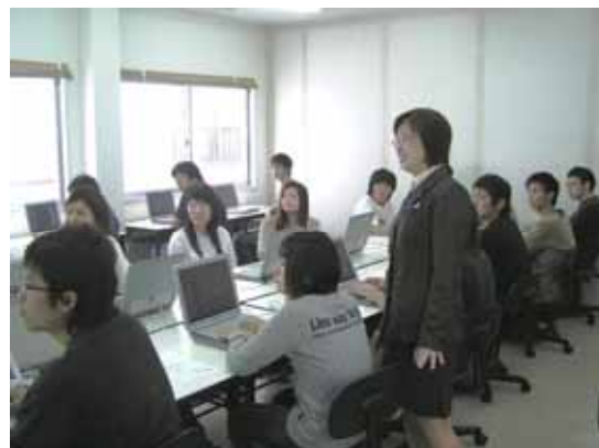
I T 資格に関連する講座の様子