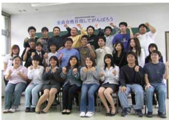
情報処理技術者試験 合格を目指す学生達