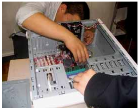
高等学校情報学科における講座の様子