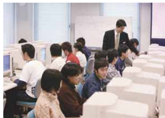
IT講座の実習の様子