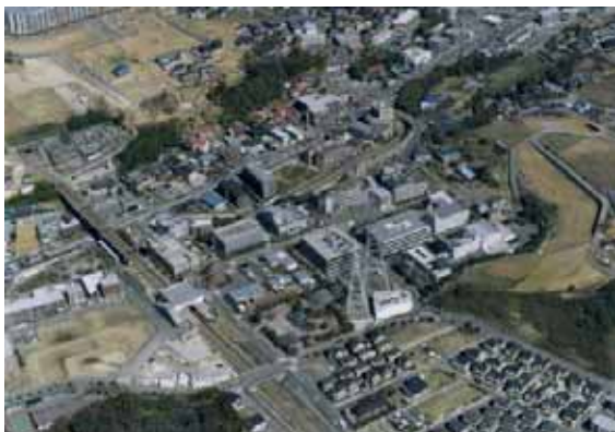
南黒川のマイコンシティ