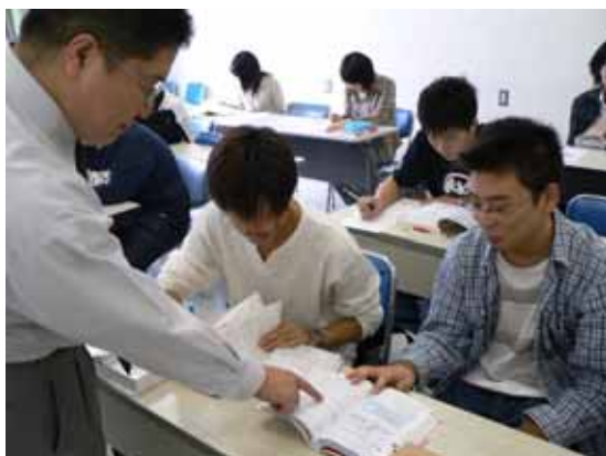
IT資格に関連する講座の様子