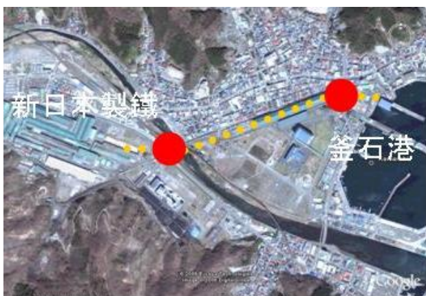
重量物輸送想定ルート