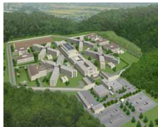
喜連川社会復帰促進センター