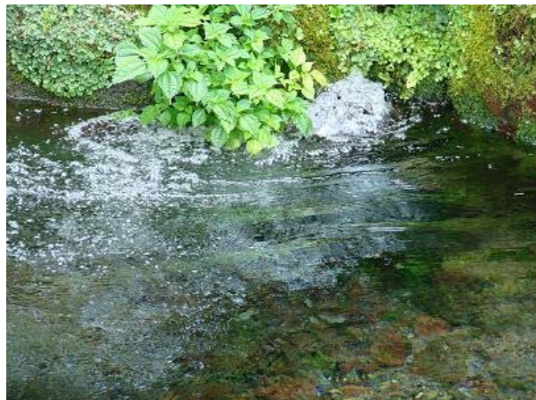
【全国名水百選 出の山湧水】