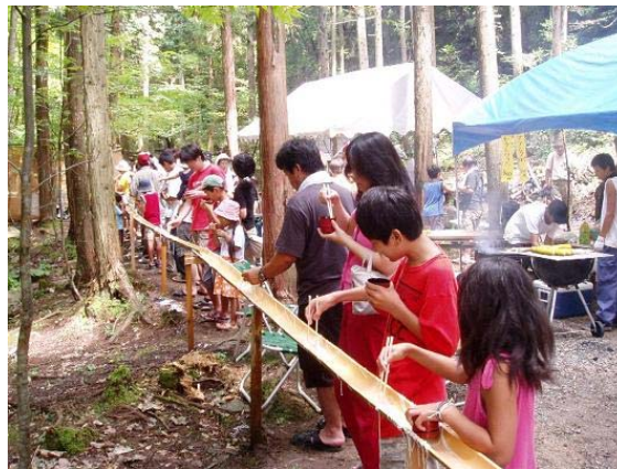
【鳴滝そうめん流し】