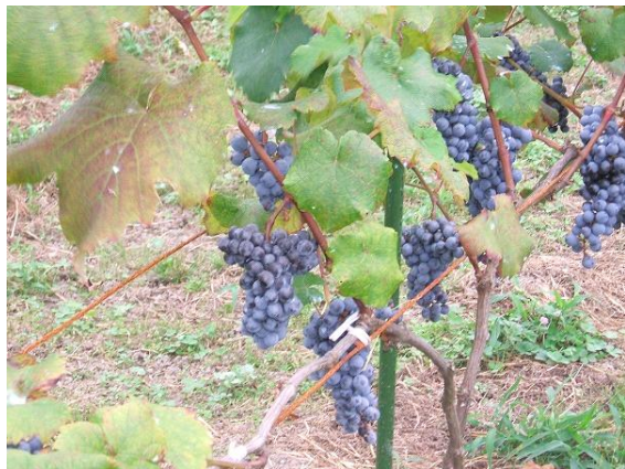
【ヤマブドウ(ヤマ・ソービニオン)】