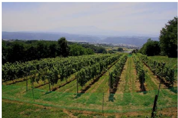
【ぶどう園からの眺め】