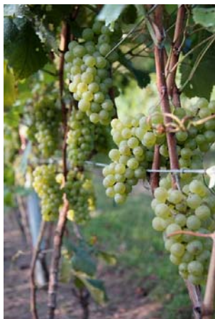
【収穫を待つワイン用ぶどう】