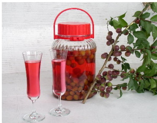
【田辺特産のパープルクィーン】