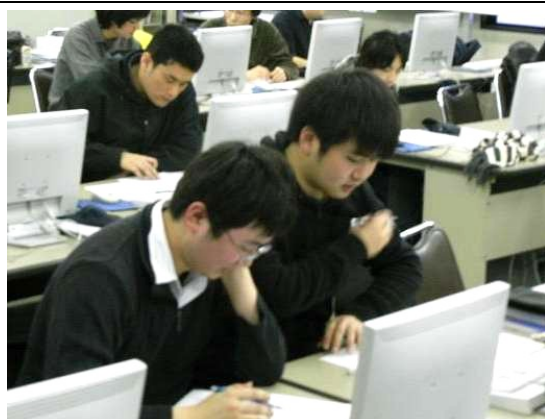
資格取得を目指す受講生