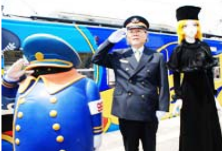
銀河鉄道 999 のデザイン電車の運行 (アニメを活用したまちづくり)