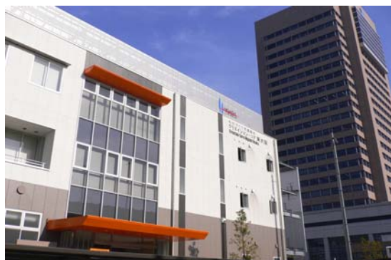
モノづくり支援拠点 (クリエイション・コア東大阪)