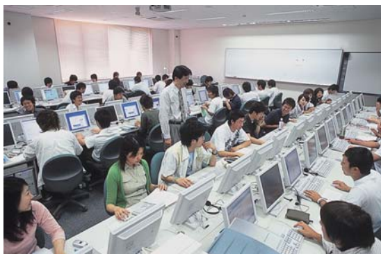
IT 資格に関連する講座風景